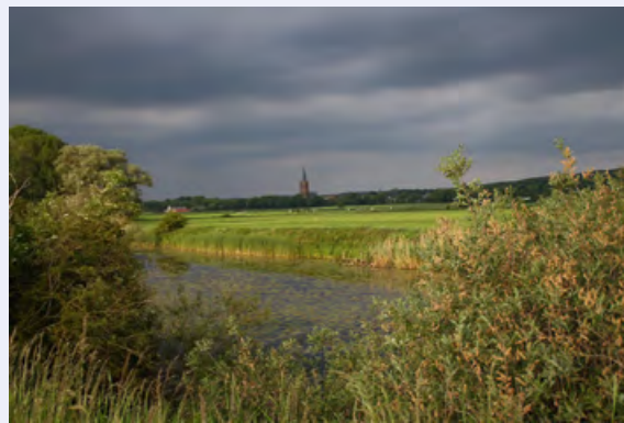
Sonja Jonkhout - Zicht op de kerk in Elten