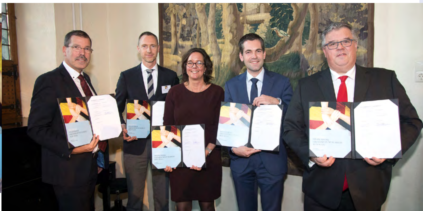
Projektlaufzeit / Projectlooptijd 01.01.2016 – 31.12.2019 Lead Partner Euregio Rijn-Waal Projektpartner / Projectpartners Sociale Verzekeringsbank, UWV Werkbedrijf Rijk van Nijmegen, Agentur für Arbeit Wesel, Deutsche Rentenversicherung, Deutscher Gewerkschaftsbund Projektkosten / Projectkosten € 1.911.236,03

Außerdem wurde in Nijmegen die Absichtserklärung für die Plattform Arbeit/dsmarkt Euregio Rhein-Waal unterzeichnet. In der Arbeitsmarktplattform arbeiten Vertreter von Arbeitgebern und Unternehmen, Arbeitsvermittlungsorganisationen, Gewerkschaften, Bildungsreinrichtungen und Kommunen beiderseits der Grenze eng zusammen. Dort sollen Hemmnisse des grenzüberschreitenden Arbeitsmarktes aufgedeckt, Ursachen ermittelt und gemeinsame Lösungen gefunden werden. Durch Ideen und Aktionen soll unbürokratisch der grenzüberschreitende Arbeitsmarkt stimuliert werden. Weitere Informationen finden sich unter www.grenzinfo.eu . ●